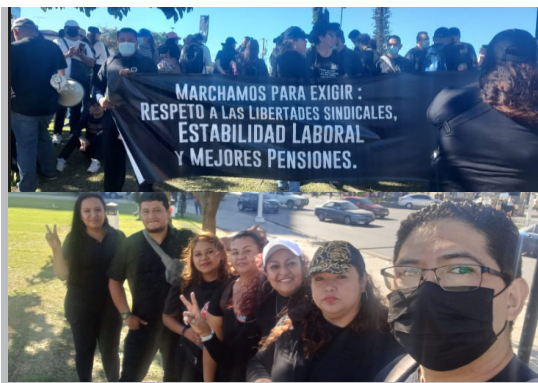
EN LA FOTO. Sindicalistas de STIVES - Seccional Impresion Apparel, F&D, junto a Directivos Federales usando la camisa negra en símbolo de protesta ante una reforma del sistema de pensiones que es desigual y con muchas deudas.