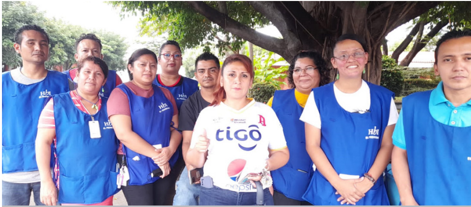
Directivos Sindicales de Seccional Confecciones El Pedregal -STIVES