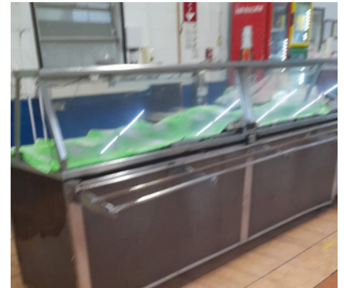
Cafetería de Textiles la Paz, ahora los alimentos permanecen cubiertos

Las y los Trabajadores de la Seccional por empresa Textiles la Paz -STIVES, maquila ubicada en la Zona franca de La Paz, denunciaron que la comida de cafetería estaba expuestas a moscas, al grado de encontrar más de alguna en sus sagrados alimentos, poniendo en riesgo la salud de las y los trabajadores El Sindicato exigió a la empresa solucionaran el problema, y la empresa ahora implemento medidas para cuidar los alimentos de las y los trabajadores