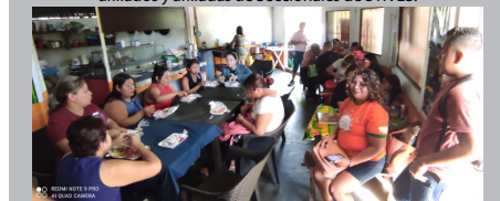
La Junta General de STIVES reunida con afiliados de Confecciones el Pedregal y Textiles la Paz